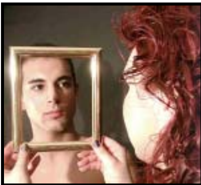
"El otro lado de la transexualidad"

Hasta el 20 de Mayo sigue la Exposición de Fotografía que organizamos desde el Colectivo en el Café Or i Ferro de Alicante (c/ belando, 12), con trabajos de J. M. GOSALBEZ y J.R. SAMPER.