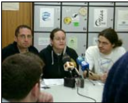
Entrevistas e información sobre actividades.

El programa será realizado íntegramente por voluntarios y colaboradores de nuestro Colectivo, y abierto a la participación de cualquier persona interesada en el mundo de la radio y la comunicación.