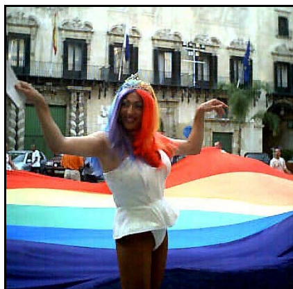
Los carnavales se vestirán de color arcoiris.