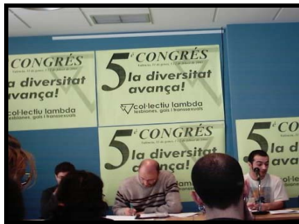
Mesa organizativa del Congreso y presentación de ponencias.

En dicho Congreso se debatió una ponencia política con las líneas estratégicas de actuación de Lambda en materia social y reivindicativa, así como una ponencia de organización para regular el funcionamiento de dicho Colectivo.